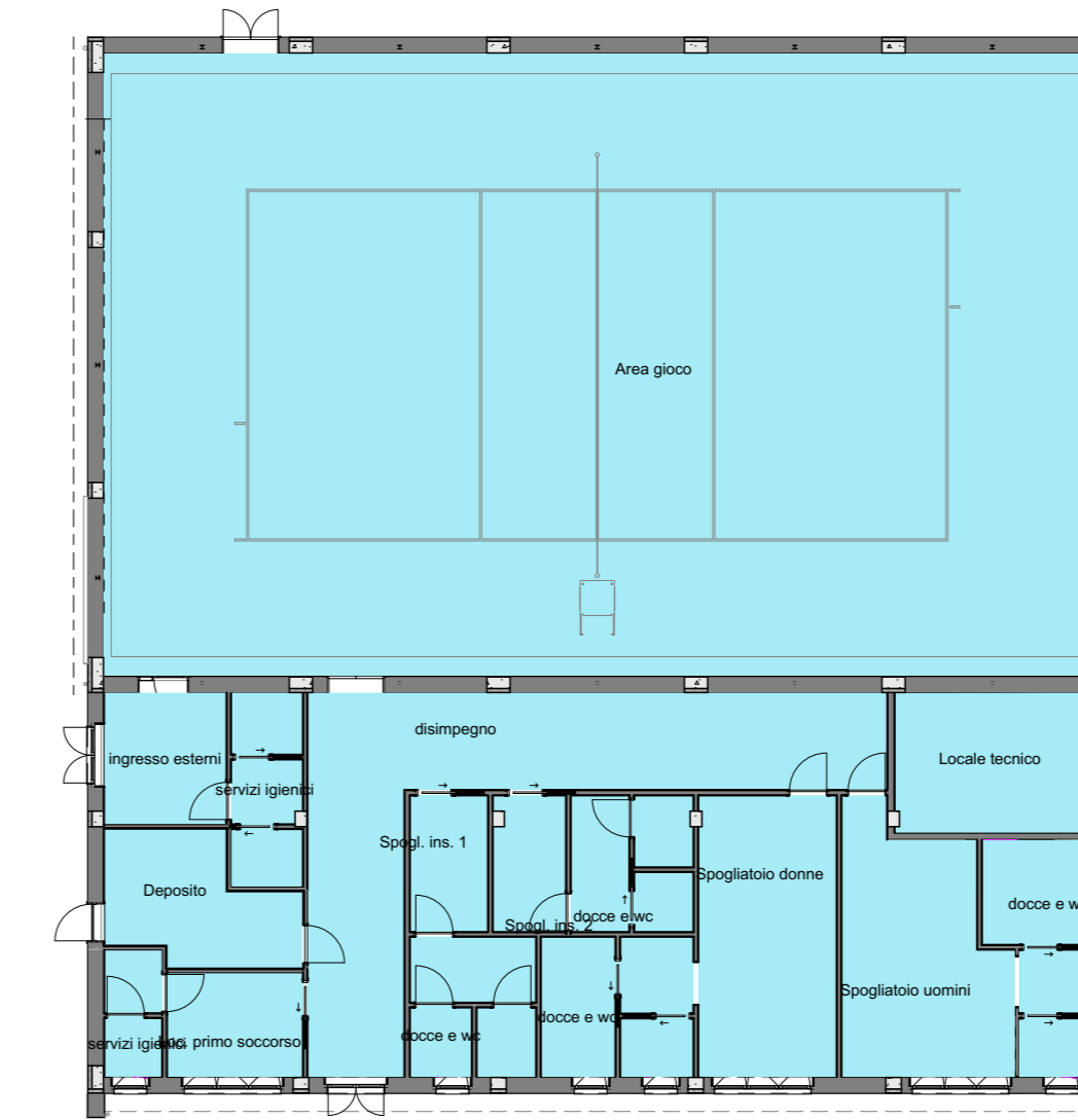
pianta piano terra _palestra