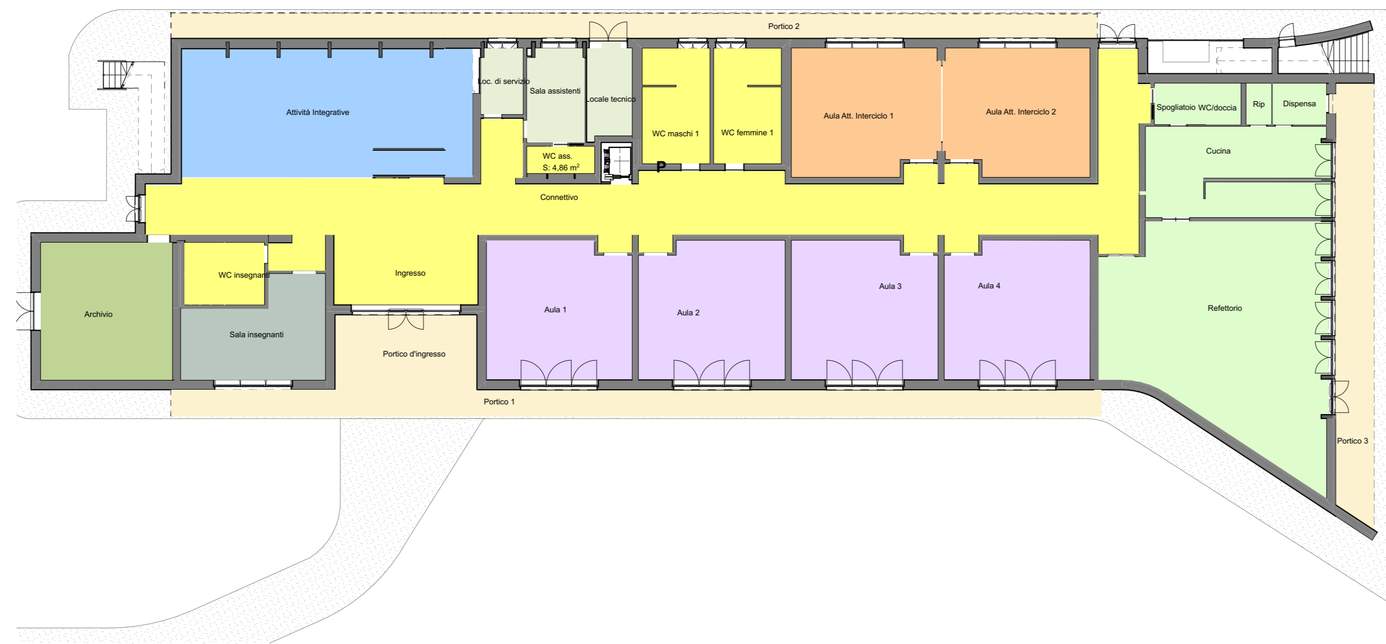
Pianta Piano Terra _scuola